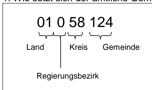
Abbildung 1: Wie setzt sich der amtliche Gemeindegchlüssel zusammen?

Ausnahme Rheinland-Pfalz: hier lautet die Gliederung: Land, Regierungsbezirk, Kreis, Verbandsgemeinde, Ortsgemeinde. Beispiel: 07 1 31 001 = Landkreis Ahrweiler, Verbandsgemeinde Adenau. In Rheinland-Pfalz wurde auf Grund der vielen kleinen Ortsgemeinden (ca. 2300) Anfang der siebziger Jahre die Ebene der Verbandsgemeinden (ca. 210) eingeführt, die für die Ortsgemeinden die Verwaltung durchführen. Auswertungen auf Ortsgemeindeebene sind für Rheinland-Pfalz aus Geheimhaltungsgründen nicht vorgesehen. Die Struktur der Verbandsgemeinden ist auch größtmäßig mit Gemeinden in anderen Bundesländern vergleichbar. Verbandsfreie Gemeinden und Städte weisen an der Stelle der Verbandsgemeinde die Ziffern 000 auf. Da in einigen Landkreisen mehrere verbandsfreie Gemeinden und/oder